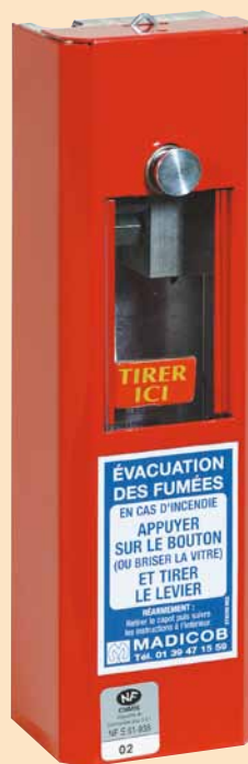
CSK 20 Ouverture seule