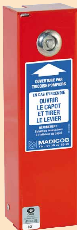
CSK 20 / CSK 100 Ouverture Seule Cage d'escalier habitation