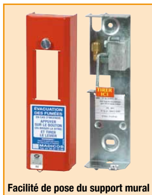
Facilité de pose du support mural