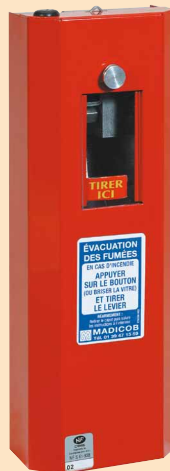
CSK 100 Ouverture seule